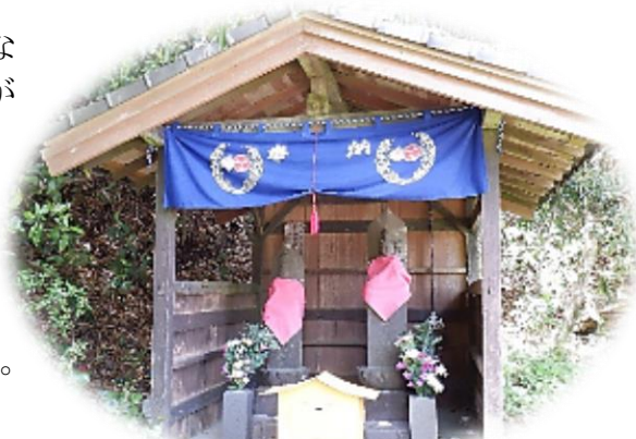
栗の木峠観音菩薩