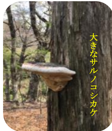
大きなサルノコシカケ