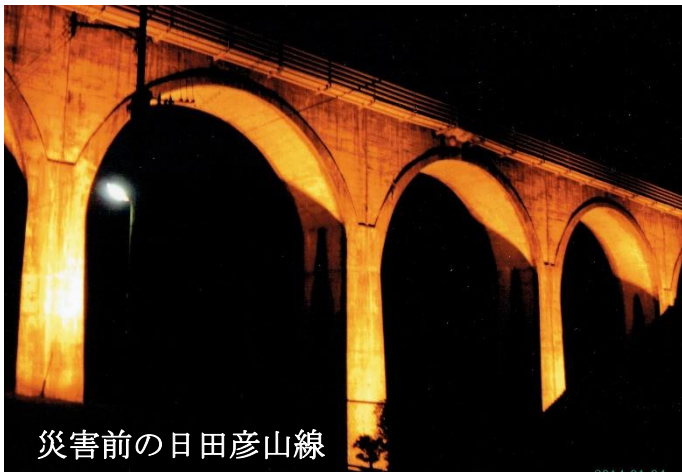
災害前の日田彦山線