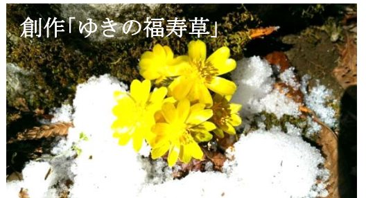
創作「ゆきの福寿草」