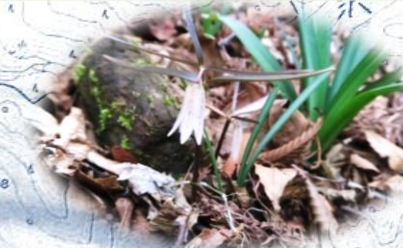
ホソバナコマイモ