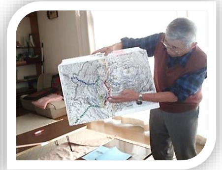
地図の見方・コンパスの使用法