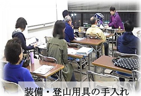
装備・登山用具の手入れ

本年度入会した会員を主にした登山教室が始まりました。 11/27には装備、登山用具の手入れ、観天望気、12/01は山行時に山歩き、ストックの使い方、初級ロープワーク(懸垂下降訓練)、12/07には地図の見方、コンパスの使用法、救急用具の使用法を行いました。