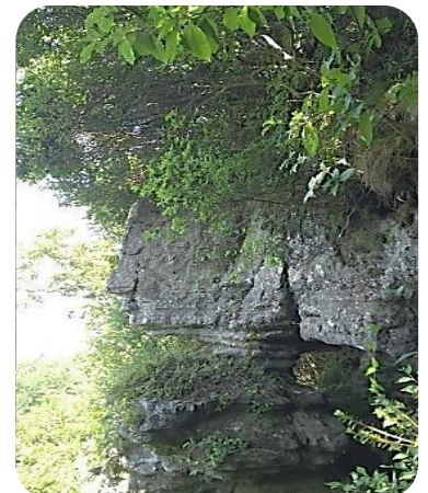
通り過ぎてしまった鼻ぐり岩