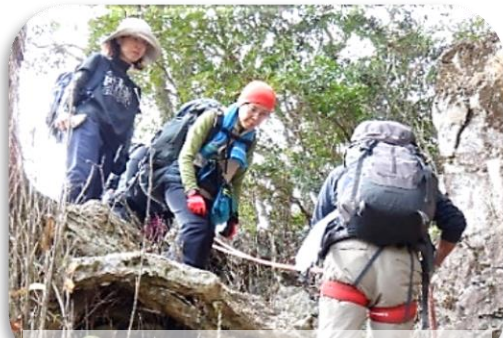
山行での懸垂下降の实地訓練