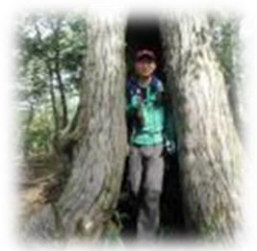
色とりどりの木の精(気のせいかな)