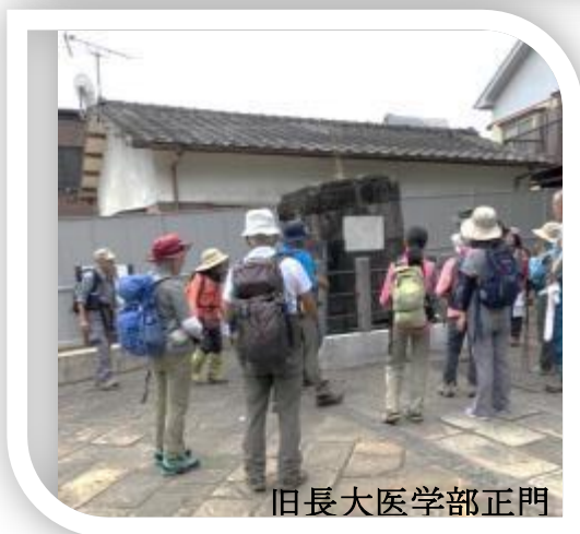
旧長大医学部正門