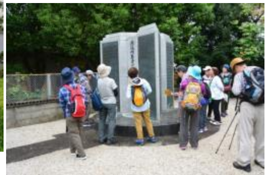
三菱兵器工場原爆死没者墓碑銘