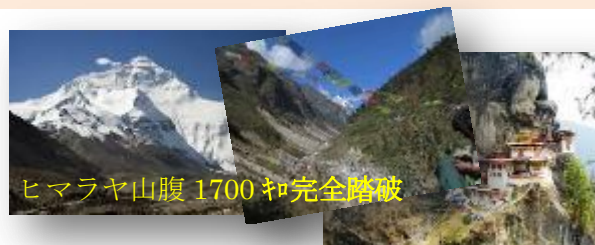
ヒマラヤ山腹1700m完全踏破