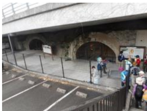
三菱兵器住吉トンネル工場跡