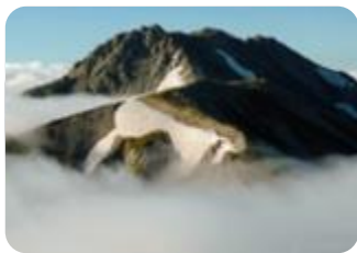
表紙 「立山三山の夏」