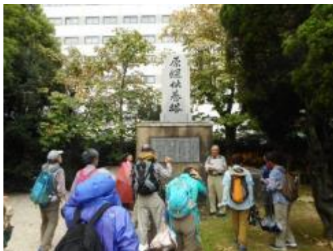
三菱兵器製作所供養塔