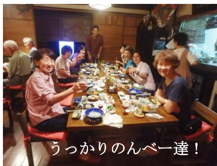
うっかりのんべー達！