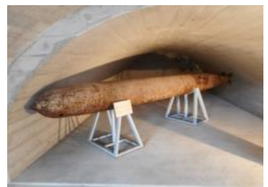
三菱兵器住吉トンネル工場 魚雷