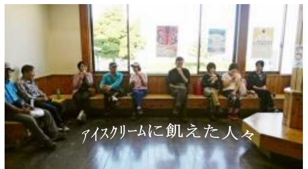
アイスクリームに飢えた人々

*九州の脊梁山脈。さすがに山深く登山口までも遠かった。山頂からは山また山の眺望で、紅葉にはまだ早かったが、十分楽しめた山行でした。