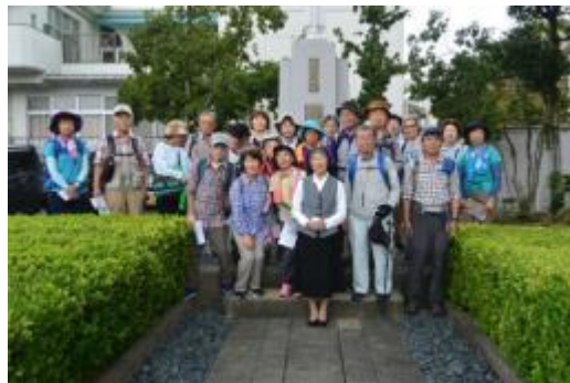
純心、聖母マリア像の前にて (シスターの説明もから揚げもうまかった)