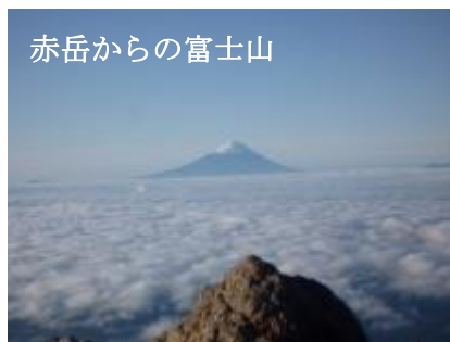
赤岳からの富士山

6/13 晴天 4:10 御来光を拝む。4:30 赤岳へ。鎖場はあるが横岳よりも危険度は少ない。頂上からは雄大な富士山、南・中央・北アルプスの山々が展望でき十分に満喫。山荘へ下り朝食(6:10)。下山は行者小屋までは登りと同じルート。行者小屋からは南沢を歩き、“ ホテイラン ”などを鑑賞しながら美濃戸口(11:55)へ。(金丸 勝 記)