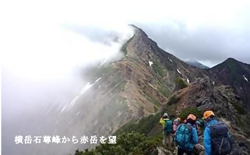
横岳石尊峰から赤岳を望

6/12 山荘発(7:00)曇空。丸太階段を登り行者小屋へ。ここからヘルメット着用。難所の地蔵尾根は石階段、鉄階段、鎖場が続きかなりハード。登り着くと地蔵の頭。お地蔵さんが笑顔で待っている。主稜線を南に進むと赤岳展望荘着(10:00)。ザックの中身を軽くして横岳へ。岩場の連続で慎重に歩く。岩稜を登るとそこには“ ツクモグサ ”の群生。雷注意報が出ていたので早めに山荘へ下る。山荘着(12:45)。夕食までは時間あり、登山者達と雑談しながらのんびりと過ごす。15:00頃から大雨。山荘でのコーヒー無料は助かったし、五右衛門風呂にも満足。食事はバイキング形式。明日は出発が早いので20:00には寝る。この頃は雨も止んでいた。夜中に起きて見た空一面の星の輝きは感動だった。