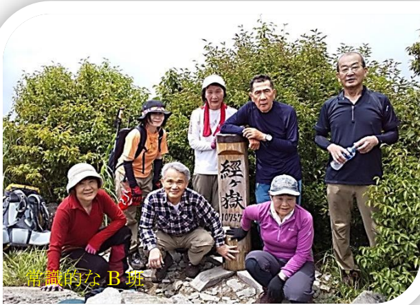
常備的な B 班

経ヶ岳登頂後の下りも急坂で、ガレ場後は徒渉も何か所もあって一筋縄では行きませんでした。例年に比べると陽射しも弱くて風も少しあり条件は良かったのですが、疲労感を訴えるメンバーもいました。