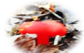
樹雨の合間の毒キノコ