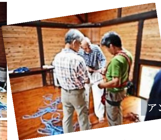
アンザイレンのロープ調整