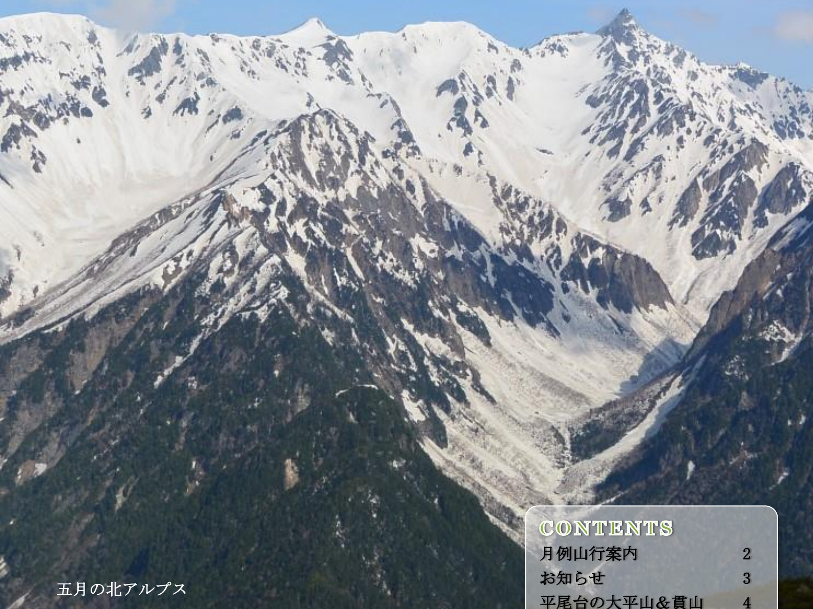
五月の北アルプス