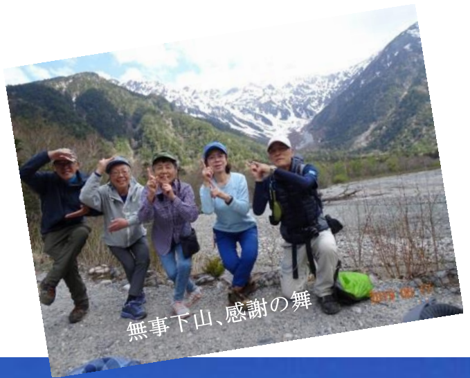
無事下山、感謝の舞