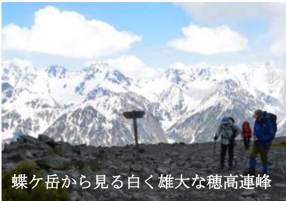
蝶ヶ岳から見る白く雄大な穂高連峰