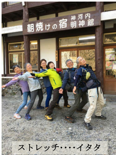
ストレッチ……イタタ