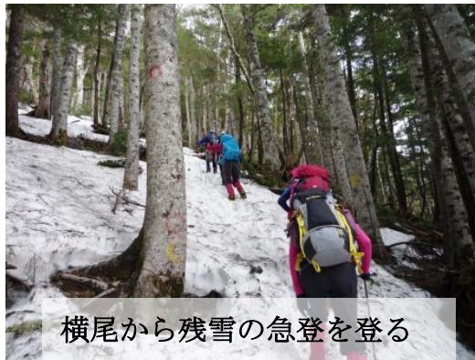
横尾から残雪の急登を登る