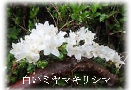
白いミヤマキリシマ