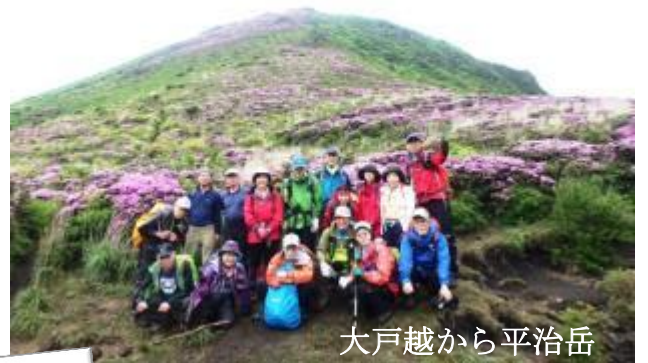
大戸越から平治岳