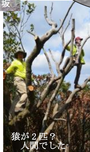
猿が2匹？人間でした

風が強く肌寒い登山日和となった。弓張岳展望台まではバスで到着。桜と九十九島の眺望を楽しんだ後但馬岳へと向かう。但馬神社の急傾斜の尾根道を昇降して但馬越分岐に到着。ここから将冠岳登山口までは車道となる。途中つわぶきをとる人もいて自然保護らしい山行を感じる。登山口から杉木立のコース途中に金毘羅神社境内があり、急な坂道を進んで将冠岳頂上に到着。帰路は同じ道とした。時間の余裕があったので、予定変更して数十万年前海水などの浸食によりできたとされている眼鏡岩を見物し、また戦時中子供たちの手で作られた無窮洞を見学して最後は梅が枝酒造に立ち寄り帰路に就いた。