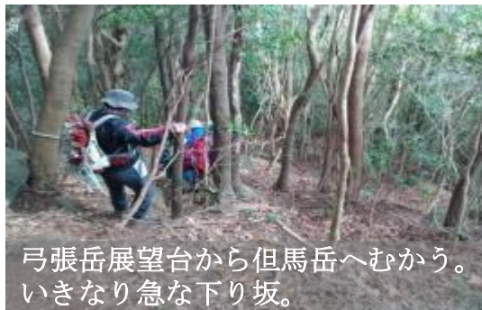
弓張岳展望台から但馬岳へむかう。いきなり急な下り坂。

復路 将冠岳 12:00~将冠岳登山口 12:25~但馬岳 13:20~弓張岳展望台 13:35-眼鏡岩 (14:10~14:25)-大塔 IC14:40~無窮洞(15:10~15:35)-梅が枝酒造(15:38~16:00)-東彼杵 IC16:33-西諫早駅 17:10