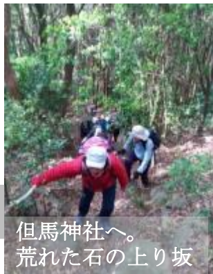
但馬神社へ。荒れた石の上り坂