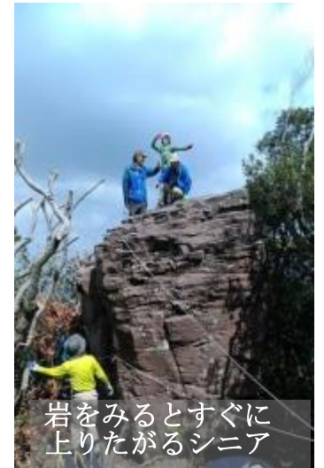
岩をみるとすぐに上りたがるシニア