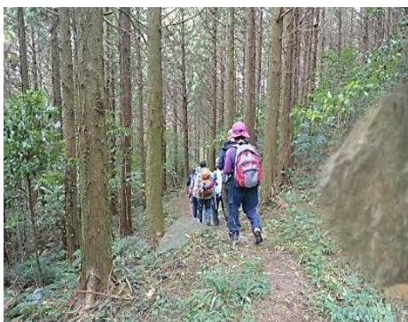
不動原の不動明王