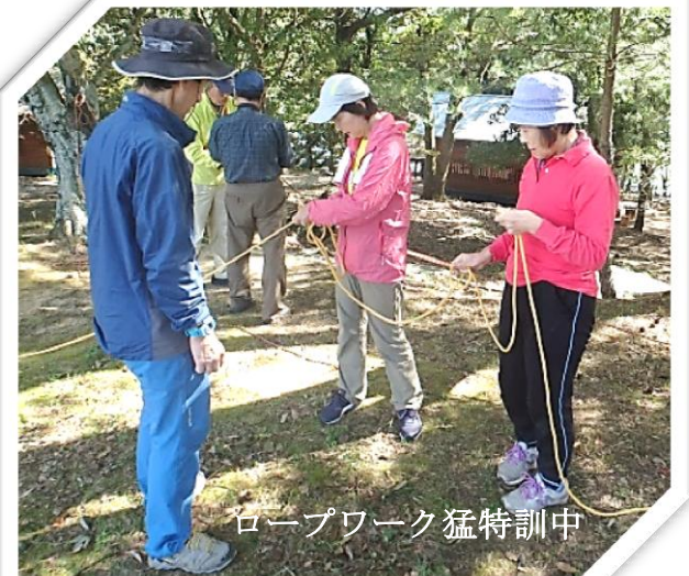
ロープワーク猛特訓中