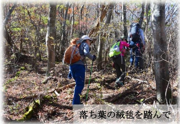
落ち葉の絨毯を踏んで