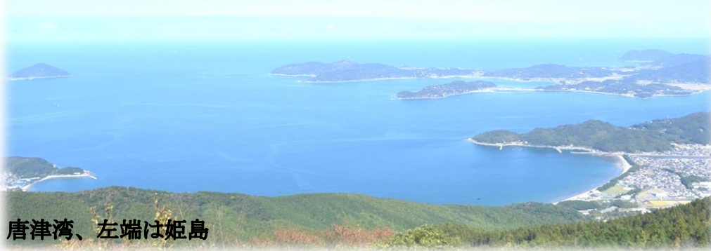
唐津湾、左端は姫島