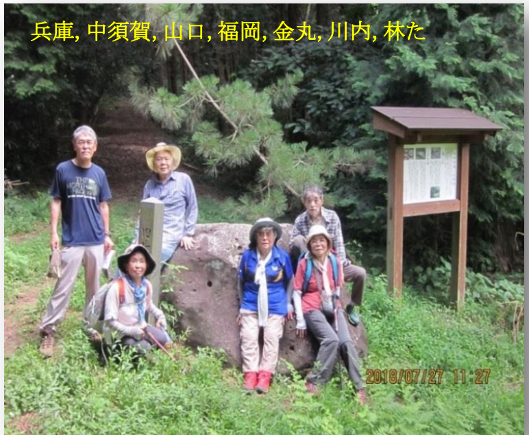
兵庫, 中須賀, 山口, 福岡, 金丸, 川内, 林た

行程 (往) 諫早駅前バスターミナル 9:30—9:45 本野バス停～10:15 亥(諫江見渡しの丘)～ 11:20 藩境石(昼食)12:10～13:10 トンネル上～14:20 今村バス停 15:35—16:00 諫早駅前