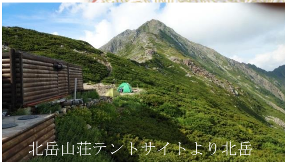
北岳山荘テントサイトより北岳