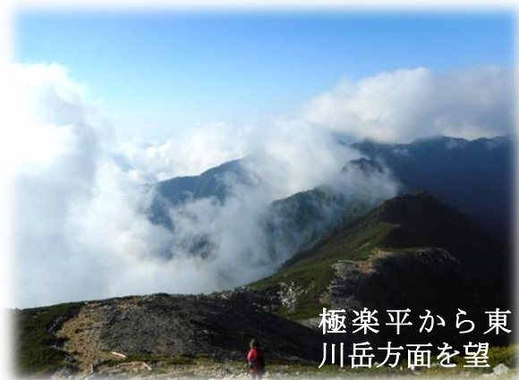
極楽平から東川岳方面を望

8/2も山荘から空木岳まではいいペースだったのですが、下り出して大地獄、小地獄などの岩場も現れて、菅の台登山口は本当に遠かった。