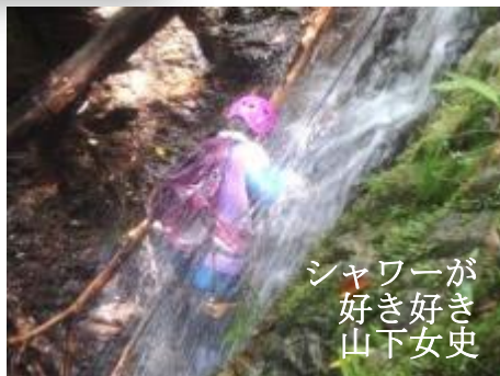
シャワーが 好き好き 山下女史