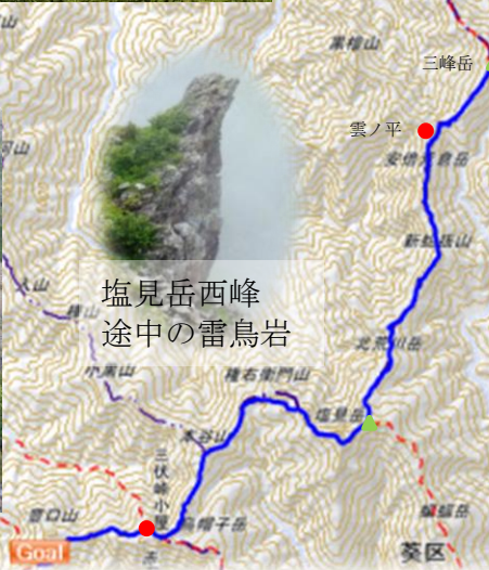
塩見岳西峰 途中の雷鳥岩