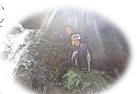
光りに包まれた川原行者様