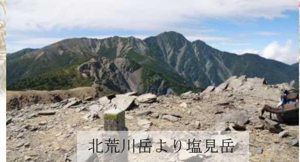
北荒川岳より塩見岳