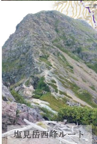
塩見岳西峰ルート