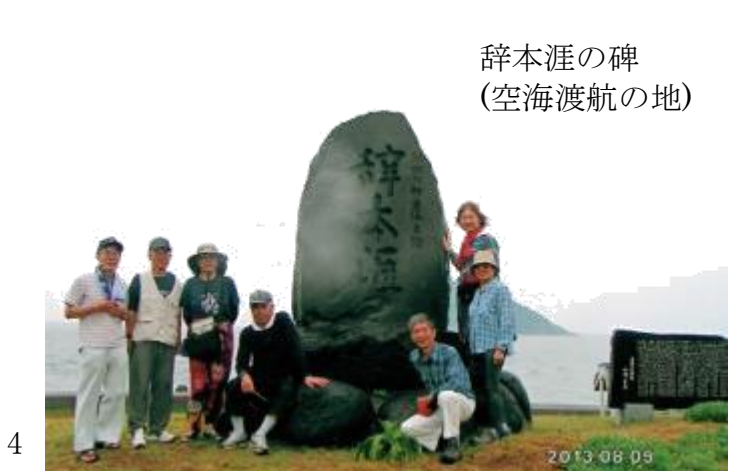
辞本涯の碑 (空海渡航の地)