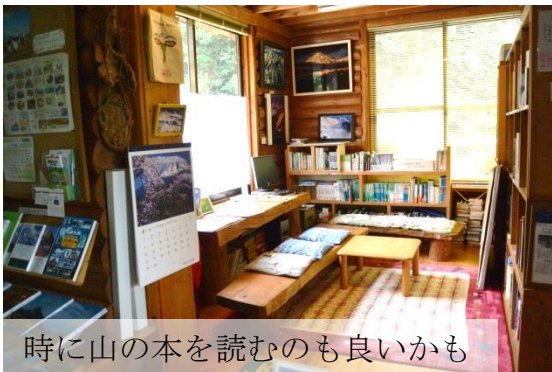
時に山の本を読むのも良いかも

山の図書館は、会員の年会費や寄付で運営されています。 現在長崎県連の会員は5名です