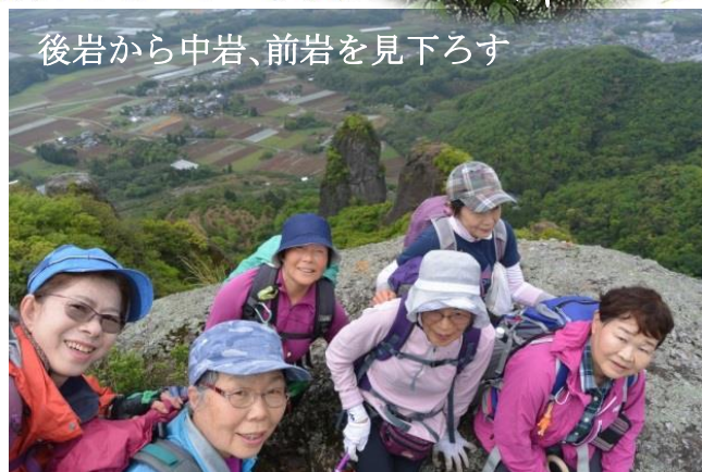
後岩から中岩、前岩を見下ろす