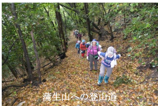
蒲生山への登山道