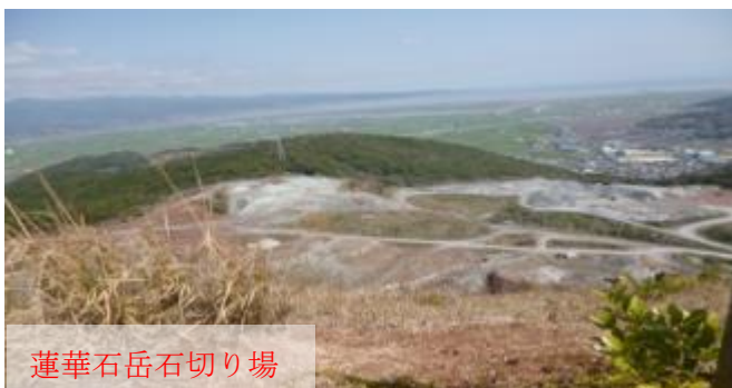
蓮華石岳石切り場