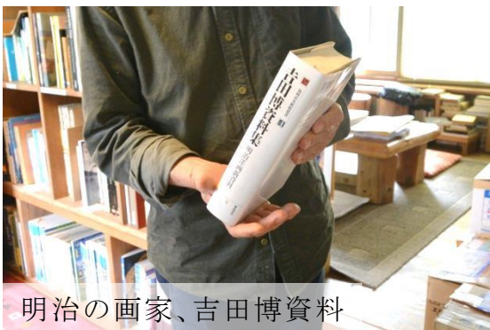
明治の画家、吉田博資料