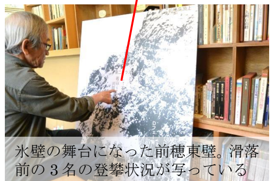
氷壁の舞台になった前穂東壁。滑落 前の3名の登攀状況が写っている