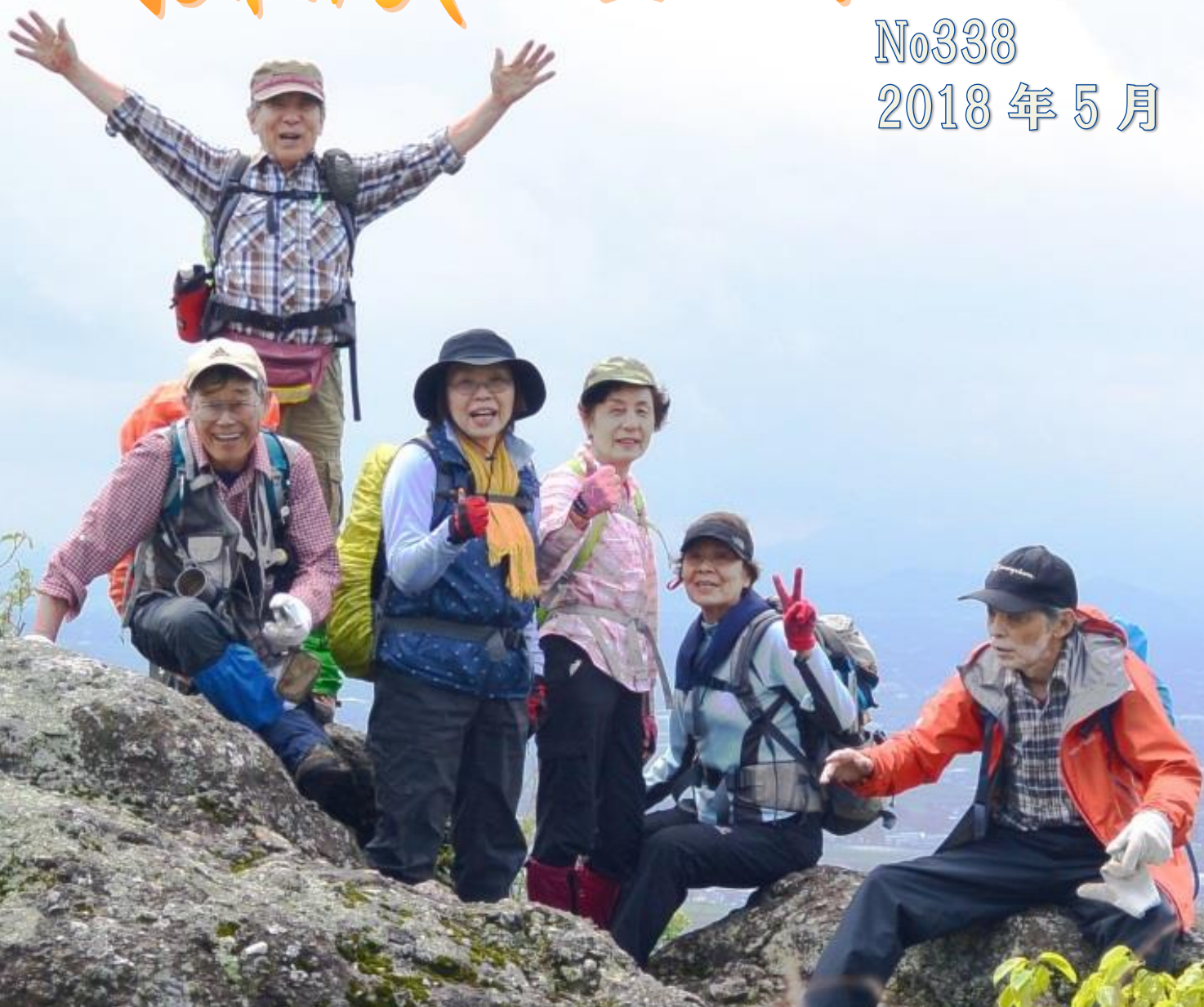
山鹿 後不動岩(背後は断崖)