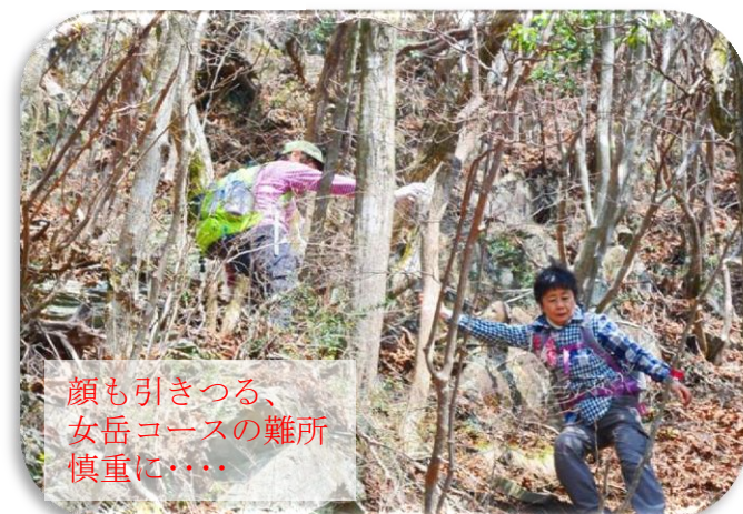
顔も引きつる、女岳コースの難所 慎重に……