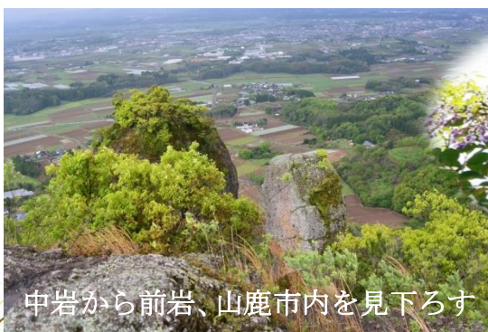
中岩から前岩、山鹿市内を見下ろす