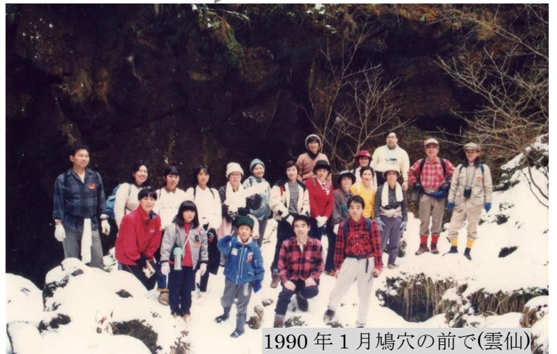
1990年1月鳩穴の前で(雲仙)

初めて取り組んだ大衆山行に27名の参加があり、入会者も得て、大きな自信になりました。会議を定期的に関く、ニュースを発行するなど、原則的な会運営がやっと軌道にのりはじめました。山行の人数もふえ、主婦の要望の中から「ひまわり」山行が生まれました。