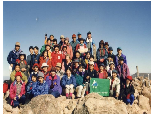
1992年10月紅葉バスハイク(久住山の頂上)