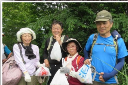
さすが、自然保護部、ごみ拾い