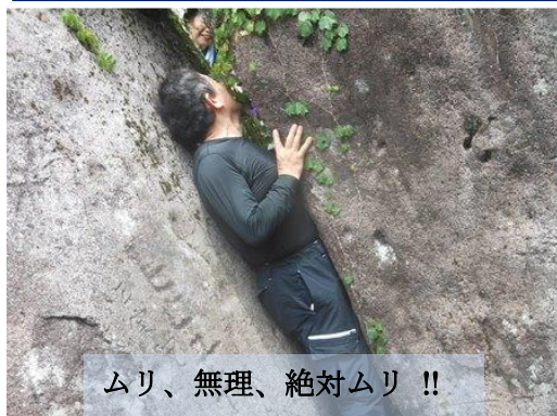
ムリ、無理、絶対ムリ !!