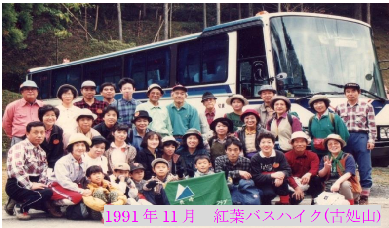
1991年11月 紅葉バスハイク(古処山)

89年1月には念願だったバスハイクを初めて実施。58名の参加と大きく成功させました。88年の1年間に28人の会員を増やしています。