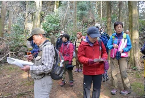
☛ 東北門あとで方角確認。