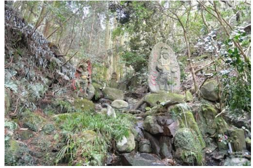
☛ お滝。昔はみそぎの場所？