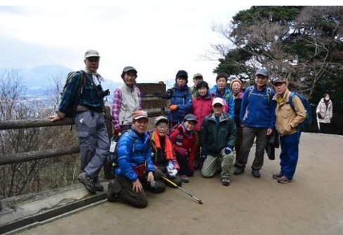
☛ やっと着いた天拝山。展望所