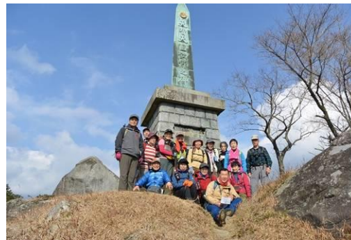
☛ 天智天皇欽迎の碑で集合写真撮影