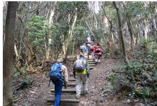
☛ 最後の急な登り。あと少しで頂上