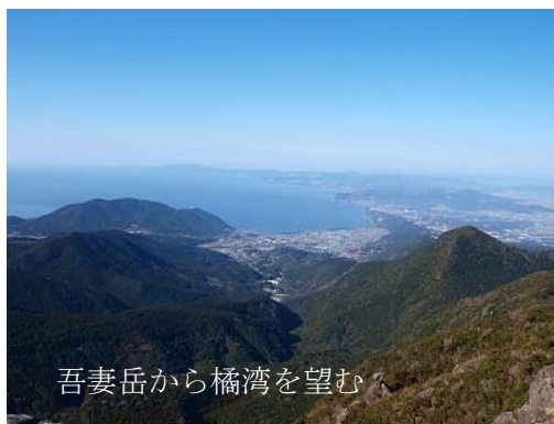
吾妻岳から橘湾を望む

とにかく水曜登山は申込みなしで大変気楽です。内容は経ヶ岳や、多良岳と厳しいときもありますが川原キャプテンがしっかりフォローされますのでとても安心です。しかも地元ですから遅く出発して早く帰られます。一度参加すると病みつきになりますよ。皆さん参加されませんか。(中野 記)