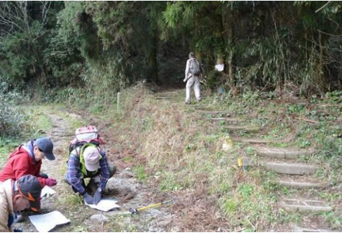
☛ 基山の登山口。コンパスを合わせる。