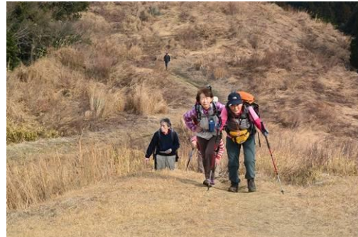
☛ ゆっくり組も必死で歩きます。