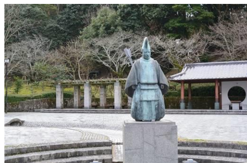
☛ 二日市温泉の発見者菅原虎磨