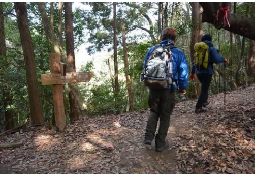
☛ なかなか着かない天拝山。