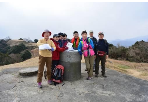
☛ 基山の頂上。あちこち眺める。