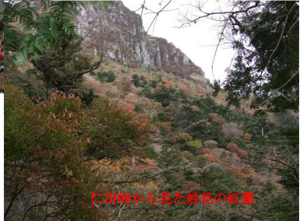
仁田峠から見た妙見の紅葉