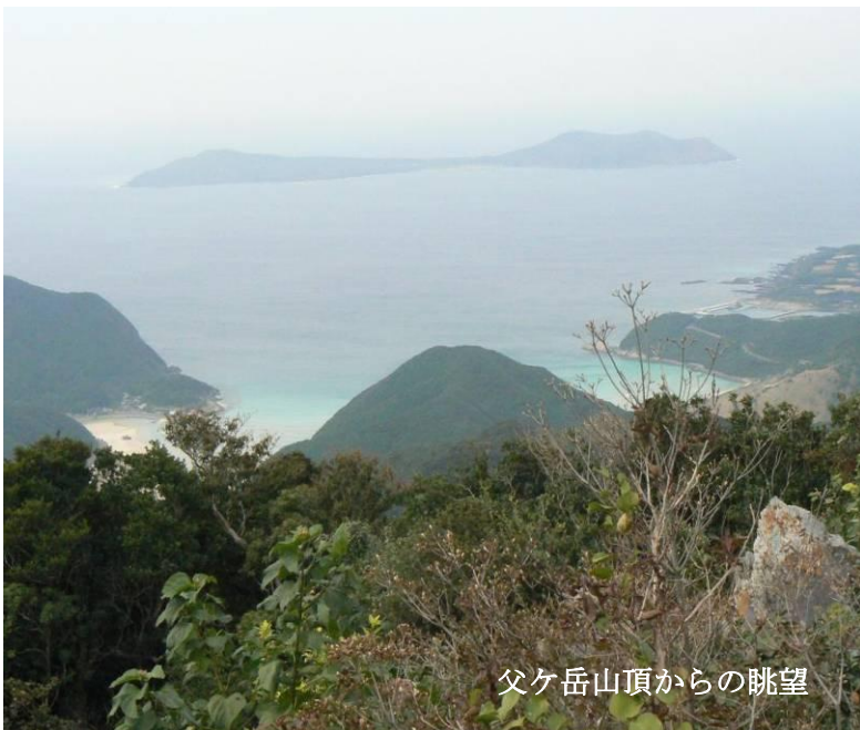
父ヶ岳山頂からの眺望