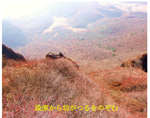
段原から坊がつるをのぞむ