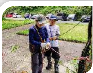
基本ロープワーク