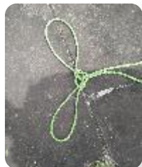
スパニッシュボーライン