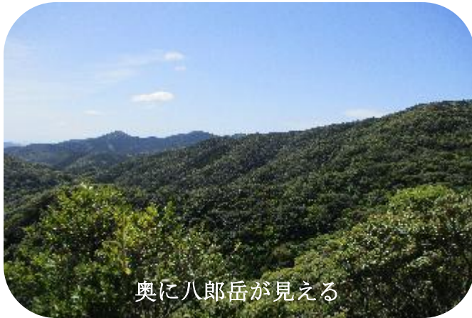
奥に八郎岳が見える

緑地公園 9:10—烏帽子岩下 P10:20～戸町岳分岐 11:15～熊ヶ峰 12:10～悪所岳 13:20(昼食 30分) 出発 13:50～烏帽子岩下 P15:00—緑地公園 16:00