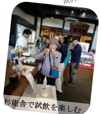
杉能舎で試飲を楽しむ