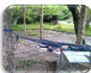
ワイヤーナンキン