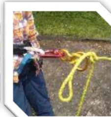
懸垂下降(エイトカン)