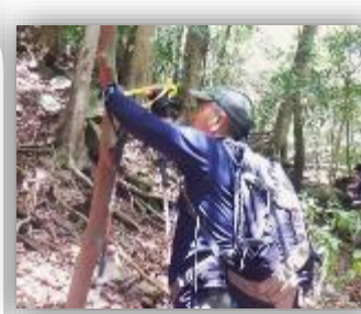
目印のテープ取付け