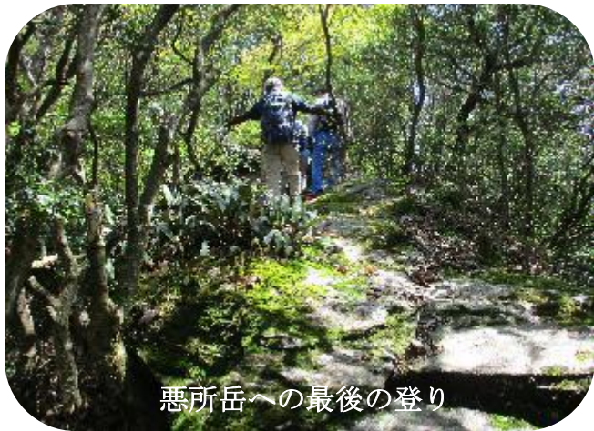
悪所岳への最後の登り