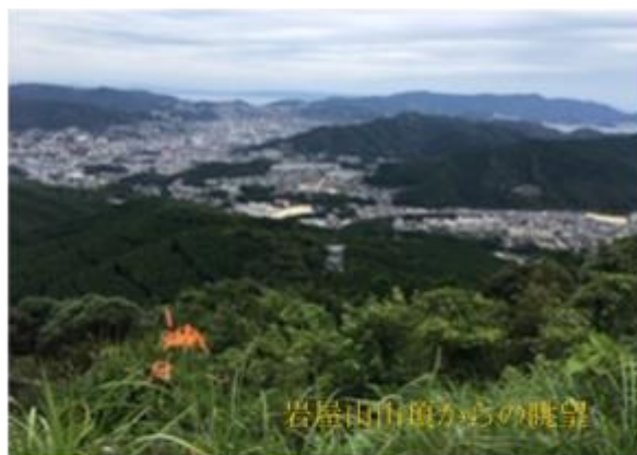
岩屋山山頂からの眺望

行程: 西諫早駅8:00—大草経由—岩屋神社9:00 —登山開始9:11—岩屋神社9:20—転び石9:45 —レイコ岩11:36—北尾根合流点12:48(昼食)13:00 —岩屋山山頂13:32—下山東南尾根を下山13:40 —六部堂尾根—駐車場着14:20—諫早15:20着