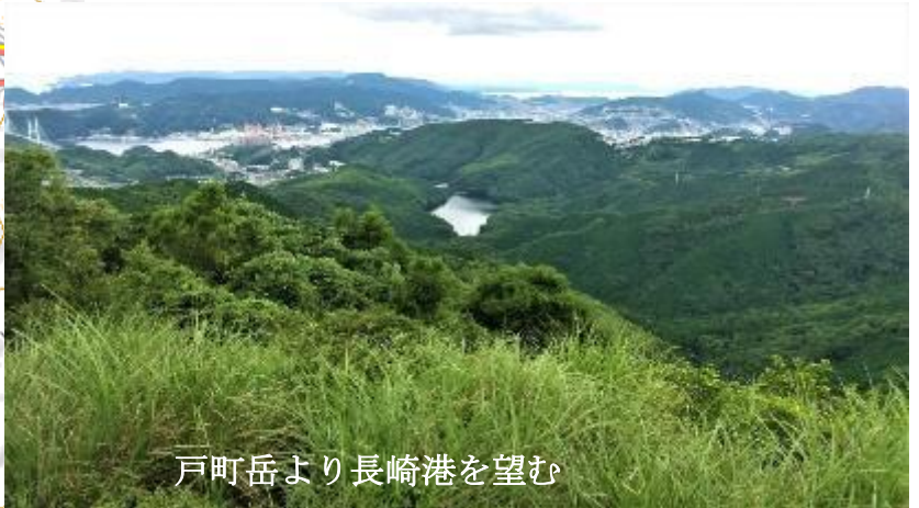
戸町岳より長崎港を望む