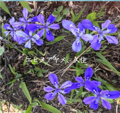
エヒメアヤメ、久住