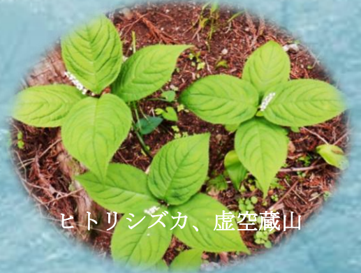
ヒトリシズカ、虚空蔵山