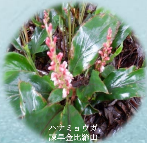
ハナミョウガ、 諫早金比羅山