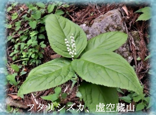
フタリシズカ、虚空蔵山