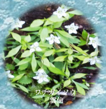
ワチガイソウ 雲仙