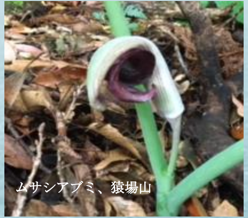
ムサシアブミ、猿場山