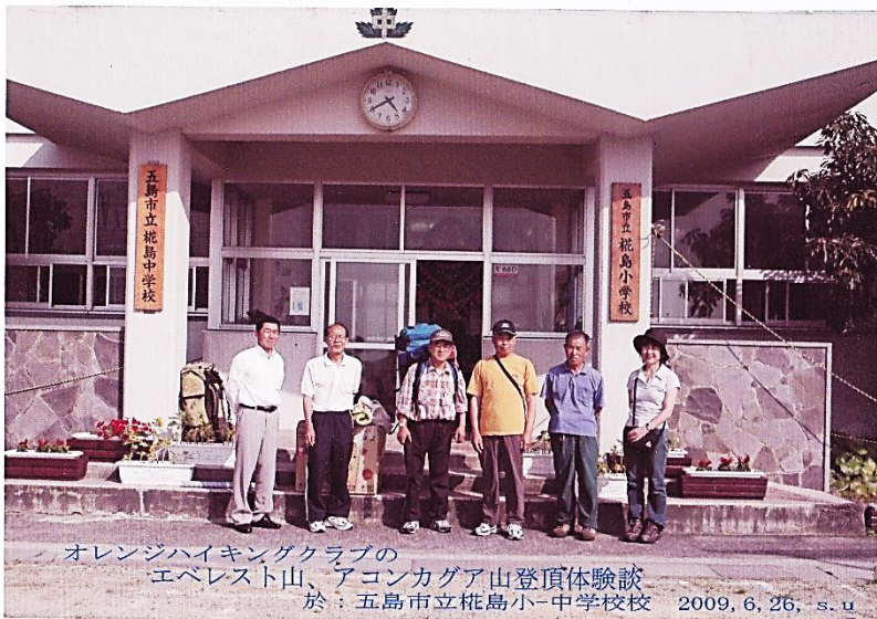
オレンジハイキングクラブの エベレスト山、アコンカグア山登頂体験談 於：五島市立柵島小-中学校校 2009, 6, 26, s.u

始めに行った島は、「柵島」と言う福江港から渡海船で二五分ほどの南西方向に浮かぶ島である。