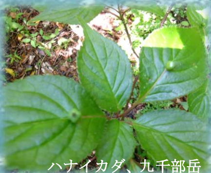
ハナイカダ、九千部岳