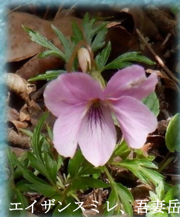
エイザンスミレ、吾妻岳