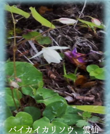
バイカイカリソウ、雲仙