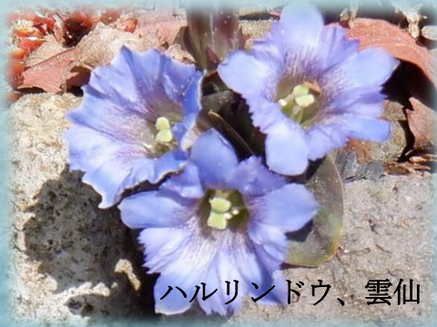
ハルリンドウ、雲仙