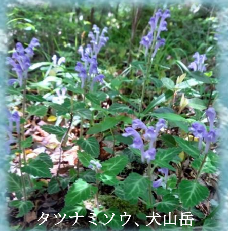
タツナミソウ、犬山岳